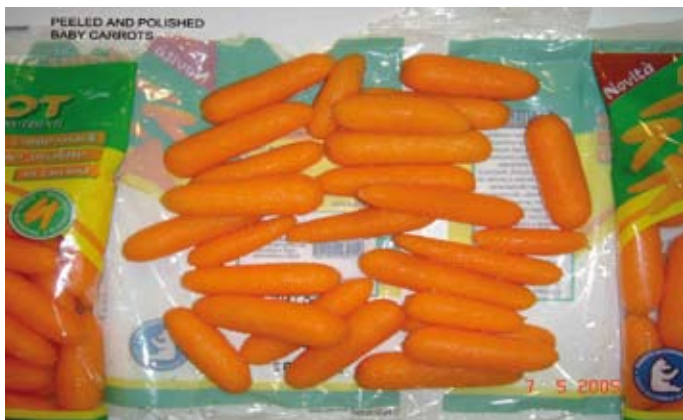
Proceso con zanahoria Imperator, desde el producto entero hasta su acabado como zanahoria baby.