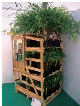
Algunas novedades pensadas para el distribuidor son las que se muestran en las fotografías: Muglino, Box Topiary y Bambox.

efectivamente, vale la pena. Habiendo encontrado allí algunas nuevas perspectivas muy interesantes, señala que "ha sido muy importante estar allí y encontrarse con nuestros clientes franceses. Además, hemos tenido la oportunidad de encontrar otros clientes y clientes potenciales de otros países".