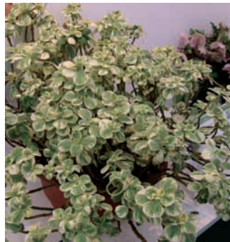
Coleus canina variegata 'Sumcom' y Rosa 'Star Profusion' (sobre estas líneas) son dos de las novedades ornamentales presentadas en el Salon du Vegetal 2007, así como 'Impatiens Divine' y Hydrangea 'Vanille' (debajo).

En esta categoría también se concedieron un 2º y 3º premio y una mención especial del jurado. El 2º premio fue para "Magic Stars", de Dümmen France. Se trata de un nuevo concepto de marketing para la promoción de poinsetias como regalo de Navidad. Es un receptáculo que contiene tres macetas de 9 cm pre impresas en rojo, rosa o blanco, con colores haciendo juego con ese receptáculo. El conjunto se presenta con una tapa transparente.