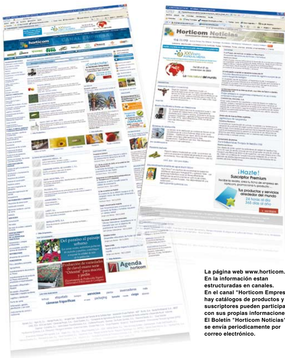
La página web www.horticom.com En la información están estructuradas en canales. En el canal "Horticom Empresas" hay catálogos de productos y los suscriptores pueden participar con sus propias informaciones. El Boletín "Horticom Noticias" se envía periódicamente por correo electrónico.

Todos quieren saber más; la demanda de conocimiento es global, los cultivadores no quieren saber solo de abonos, sino cómo vender más, a dónde y con más valor. Los contenidos de la revista son también globales entre las informaciones que interesan a toda la industria hortícola, tecnología, poscosecha, comercio, logística, hábitos de consumo, etc.