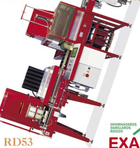
RD53 Desapilador automático