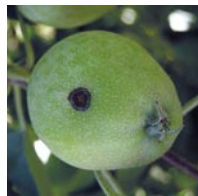
En la fotografía superior observamos un ácaro depredador fitoseido. En la inferior se ve el moteado de la manzana.

El control de patógenos presenta mayor dificultad de control que los artrópodos plaga, por lo cual la utilización de productos de síntesis es más necesaria. Actualmente se está trabajando en el desarrollo y comparación de modelos de predicción de las enfermedades más comunes (moteado del manzano y estemfiliosis del peral)