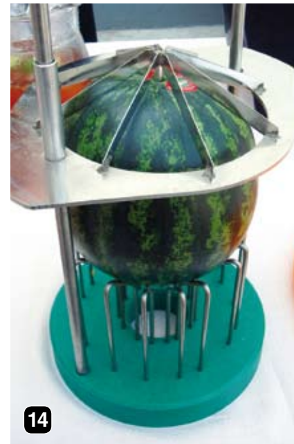
14 Agrícola Don Camilo trabaja melón y sandía; para sus invitados cuenta con un artificio que permite trocear rápidamente una sandía.

Por el tipo de negocio que es un supermercado dónde se encuentran todo tipo de alimentos, las frutas y hortalizas tienen que competir con “todos”