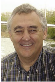
Pere Papasseit Totosaus