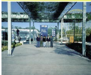
Construcción de las pérgolas en la EXPO'92 con plantas cultivadas sin suelo a 8 metros de altura.