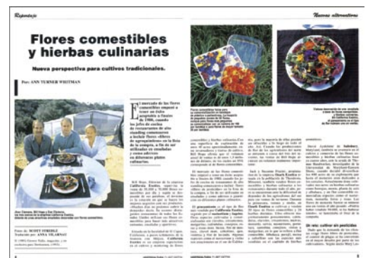
Revista Horticultura nº 71, 1991.