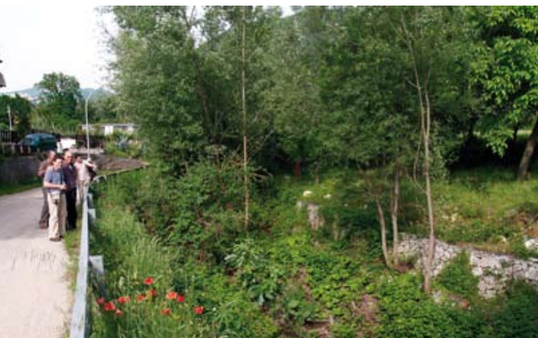
Visita al vivero en Torsanlorenzo. A su derecha foto de grupo en Torsanlorenzo.