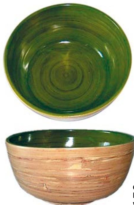
Cuenco de bambú laqueado, artesanía vietnamita.

El bambú es un material que puede sustituir con ventaja a la madera en todos los sectores en los que se utiliza ésta. Su gran velocidad de crecimiento permite extraer de 3 a 5 veces más materia prima por hectárea que cualquier especie forestal. Por lo tanto, la utilización de este material podría aliviar la presión que la demanda de madera ejerce sobre los bosques, y al mismo tiempo contribuir a frenar el efecto invernadero.