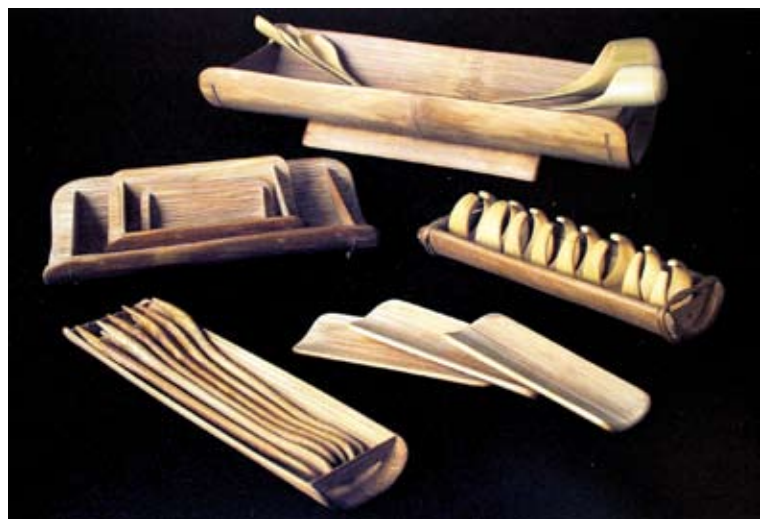
Utensilios de cocina, artesanía tailandesa.

El bambú tiene resistencia máxima cuando se halla sometido a tracción, sin embargo en las construcciones tradicionales se lo utiliza cargado a compresión. Actualmente la