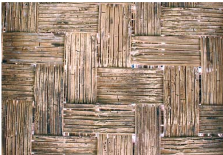
Tablero de cañas abiertas colocadas

Dada su elevada flexibilidad es muy fácil plegar el bambú para las más variadas aplicaciones. Las tiras finas se pliegan hasta el punto de permitir la realización de ataduras. Los listones se pueden plegar con radios de curvatura muy pequeños sin romperse. Utilizando listones de bambú en lugar de armaduras y correas, es posible