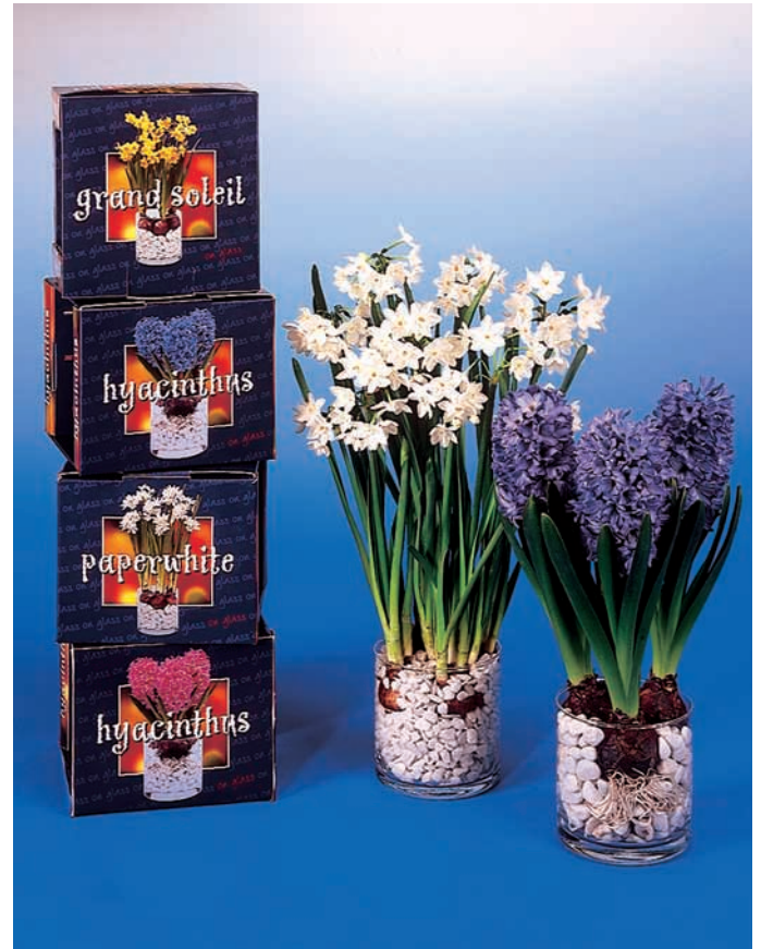
En las fotos superiores, distintas presentaciones en vasos de cristal y abajo izquierda un envase de Candidum.