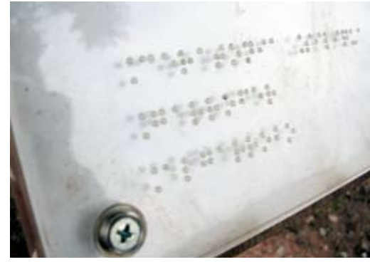
Placa con información en sistema Braille.

Las barreras con las que se encuentran algunos grupos de personas pueden ser temporales o permanentes. Muchas barreras son consecuencia de actos vandálicos, conductas poco civilizadas, obras, falta de mantenimiento, etc. El objeto de los proyectos de accesibilidad es eliminar las barreras permanentes con un diseño adecuado de beneficio universal.