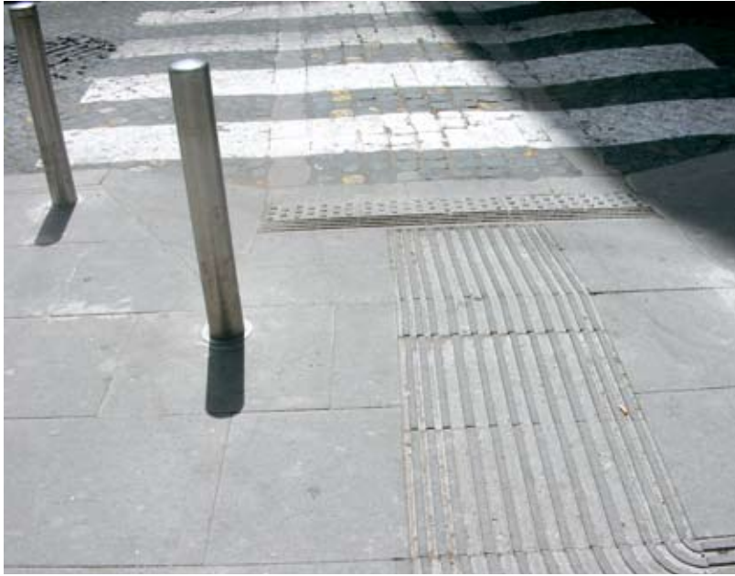
Este pavimento de acanaladura señala direccionalidad en una calle de Roma.