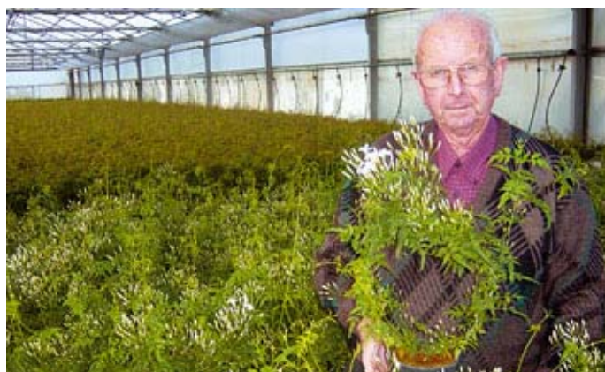
Planta de Jardín