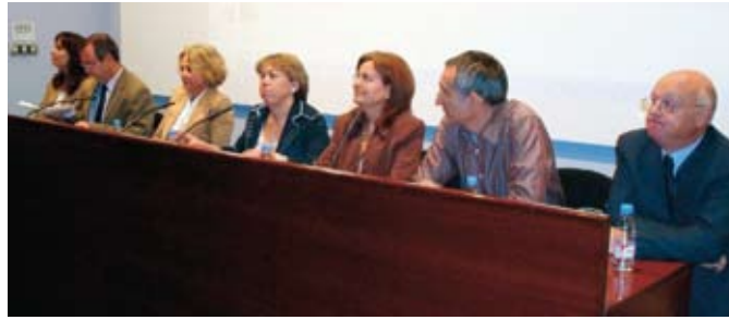
La imagen corresponde a la mesa redonda realizada una vez finalizada la Jornada de conferencias, con todos los ponentes que participaron en ella, todos con un lema común de “Exigencias y retos de los tratamientos poscosecha: ¿cómo afrontarlos?”.

La situación actual es que las cadenas, ante la alarma social que generan las campañas de Verdes, Greenpeace, etc., optaron por posturas sumamente restrictivas, que repercuten en la producción, dando lugar a los diferentes protocolos de residuos. Estos rebajan los LMR oficiales a un 70% de su valor y crean un nuevo criterio, el ARfD o nivel de referencia aguda, un valor que carece de fundamentos legales para su medición. Pretende fijar un criterio sobre la cantidad de residuos que puede consumirse en una ingesta o durante un día sin perjuicio para la salud.