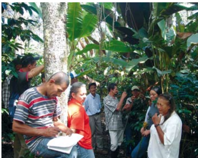
Grupo de agricultores, asociados a Asoheliconias en capacitación.