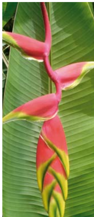
Cultivo de heliconias.