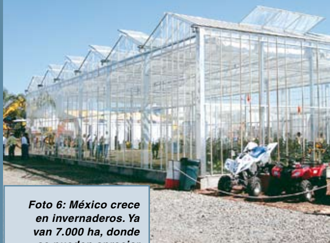
Foto 6: México crece en invernaderos. Ya van 7.000 ha, donde se pueden apreciar invernaderos de cristal y de alta tecnología como el de la foto.

Foto 7: México exporta gran parte de su producción a EE.UU. y las casas de semillas no paran de investigar sobre nuevas variedades que requieren los productores.