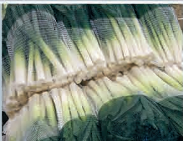
Bolsas de malla de punto