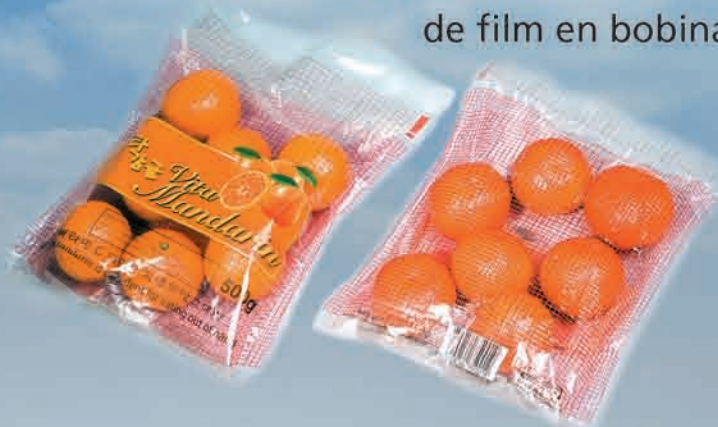
Bolsas de film en bobinas