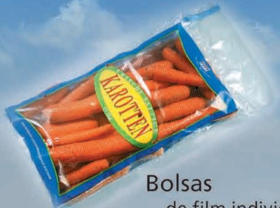
Bolsas de film individuales