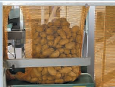
Bolsas de malla tejida