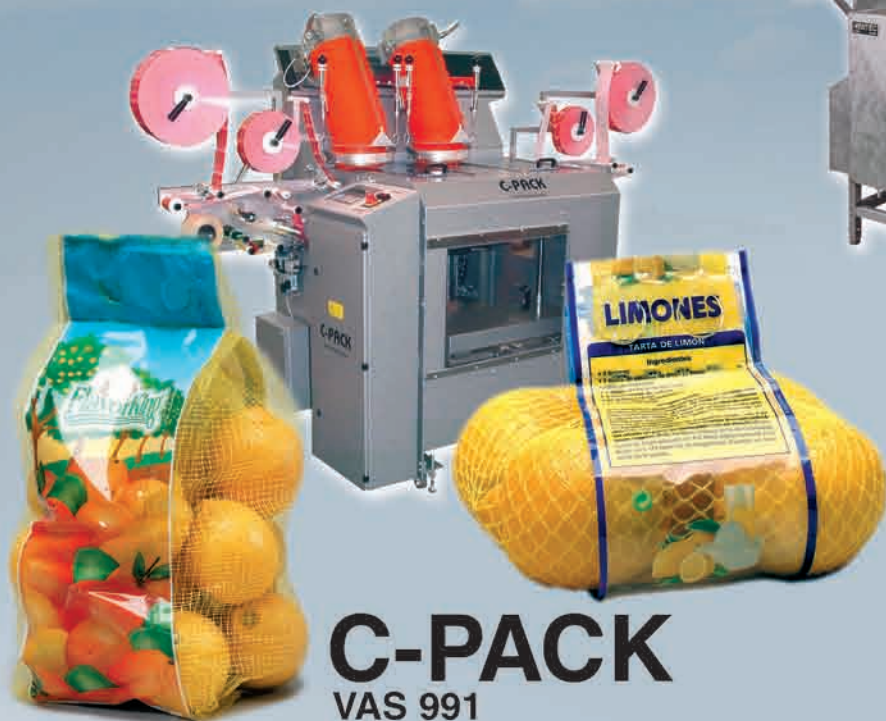
C-PACK VAS 991