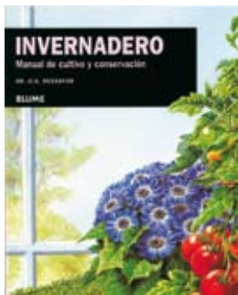
Invernaderos Manual de cultivo y conservación D.G. HESSAYON

Este libro contiene información sobre la estructura y el equipo necesarios para establecer un invernadero, qué especies cultivar en él, qué formas de cuidado precisa, qué problemas pueden surgir y qué soluciones dar a ellos, así como un extraordinario y práctico calendario para el cultivo en cada época del año.