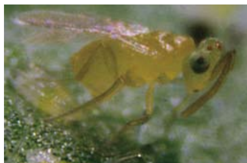
Adulto Eretmocerus mundus .

Éste tiene la ventaja de que parasita en zonas del cultivo donde la negrilla es abundante. A. swirskii abandona las áreas donde la negrilla se ha