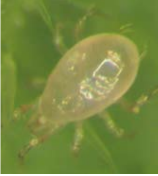
Detalle de A. swirskii adult

establecido. Eretmocerus no se utiliza como OCB principal porque siempre va por detrás de las poblaciones de mosca y no la controla completamente hasta bien entrado el otoño.