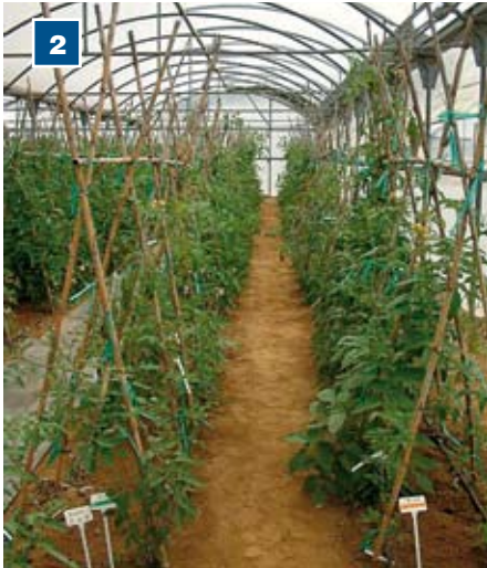
Evaluación de la respuesta de resistencia de patrones de tomate frente a Meloidogyne javanica en un invernadero con cubierta de plástico.

1.- Comparación del vigor de una planta del patrón Maxifort sin injertar y del cultivar susceptible Durinta. Como puede observarse, el patrón (en segundo plano) presenta un elevado porte y frondosidad con hojas muy grandes y extensas comparado con el cultivar (primer plano). 2.- Vista general del invernadero con cubierta de plástico en el que se llevó a cabo el experimento.