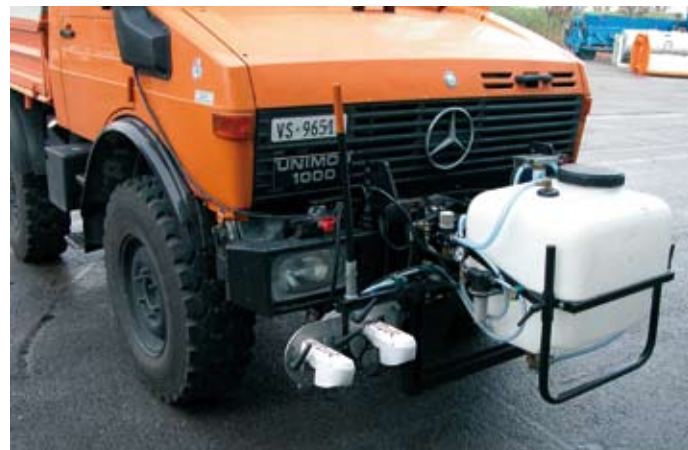
Montaje del Weedseeker delante de un camión. Su uso está destinado para desbroce enfocado en las carreteras.

Esa pulverización controlada únicamente sobre la vegetación permite economizar