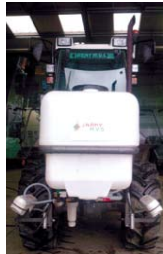
Imagen del montaje del equipo en un tractor en Francia.

Weedseeker se puede utilizar mientras se realizan otros