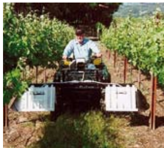
Detalle de montaje del Weedseeker encima de un quadm para el uso en desbroce en líneas de uva de EEUU.

Weedseeker es muy simple. Se compone de una caja de mando que permite administrar hasta 18 cabezales de detección. Los cabezales de detección son el centro del sistema. Se componen de tres partes: emisión, detección y pulverización. En primer lugar, emite luz – roja e infraro-