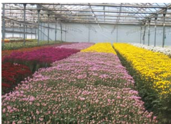
Imagen de invernadero comercial de flor cortada y del cultivo de crisantemos en invernadero de Chipiona.

mitió representar, para los cultivos estudiados, el efecto del riego sobre la lixiviación de nitratos. Intentó también acotar los posibles efectos de la adición de \text{CO}_2 y \text{O}_2 al agua de riego sobre la lixiviación y la nutrición de las plantas.