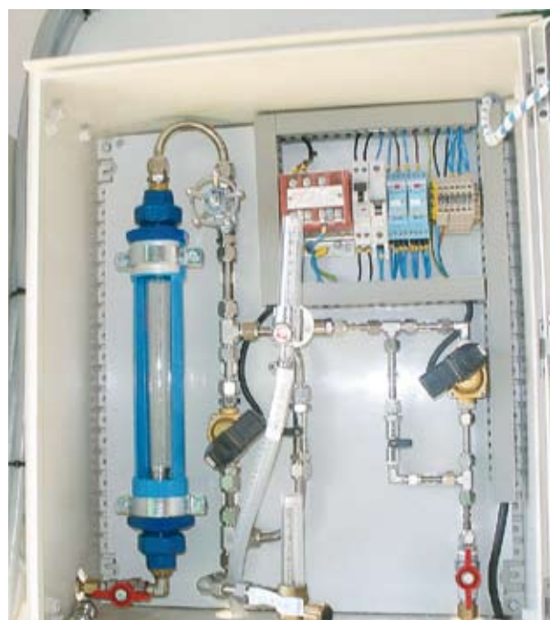
Cuadro de control Abelló Linde para la adición de gases.