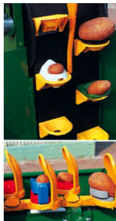
Doble correa de cangilones o vasos.

Para los tratamientos en post-emergencia del cultivo, cada vez es más frecuente recurrir a pulverizadores hidráulicos con asistencia de una corriente de aire, con el fin de mejorar la penetración de las gotas entre la vegetación y garantizar un buen tratamiento por el envés de las hojas. También es posible combinar algún tratamiento con la plantación, bien tratando previamente los tubérculos en el