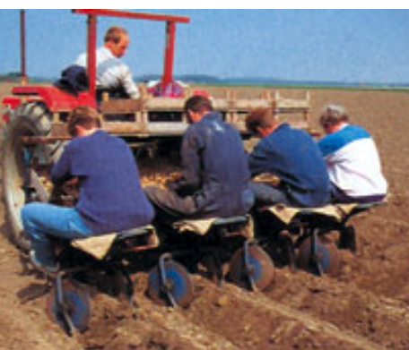
Plantadora de patatas de alimentación manual.