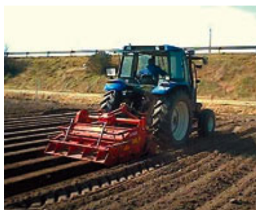
A la izquierda rotocultor acaballador y a la derecha pulverizador hidráulico con asistencia por aire.