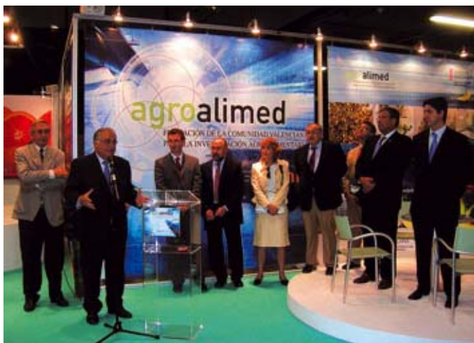
Acto de presentación de Agroalimed, Fundación valenciana para la investigación agroalimentaria creada por AINIA, IVIA y UPV, en Euroagro.