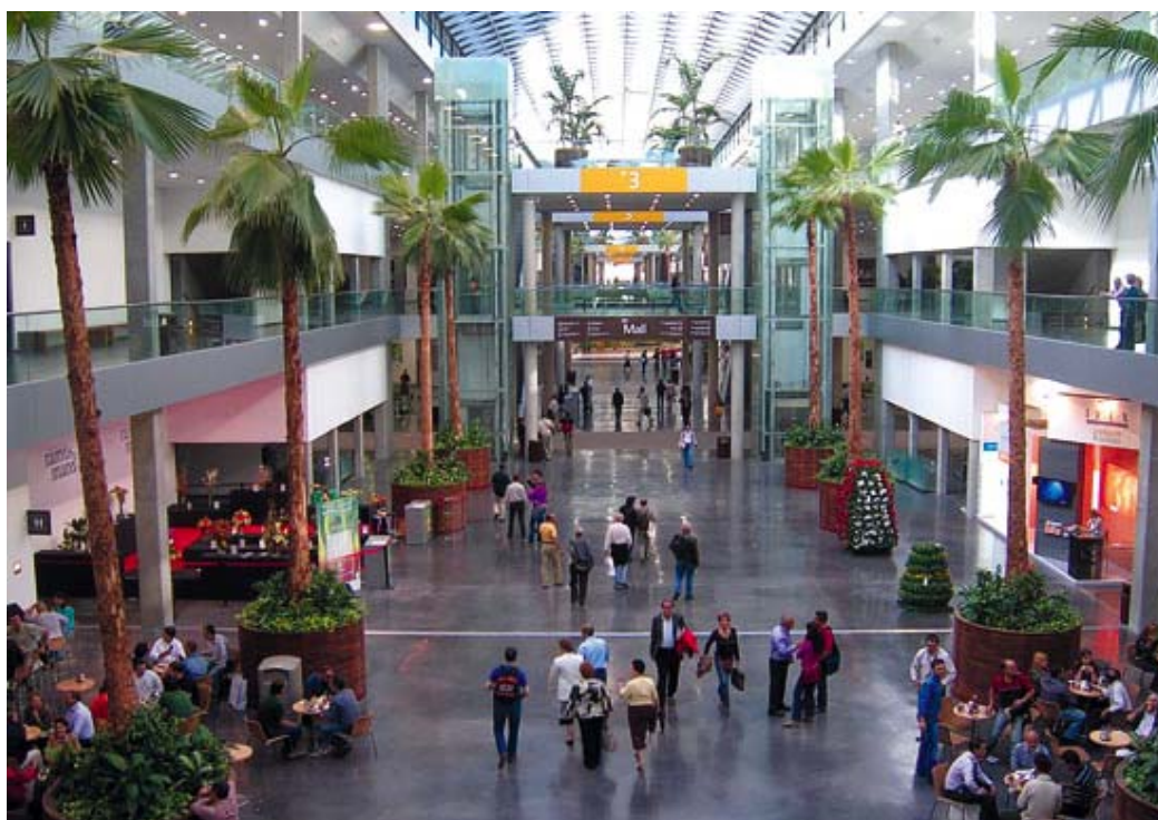
Ferias y Congresos

Con la presencia de países de todo el mundo