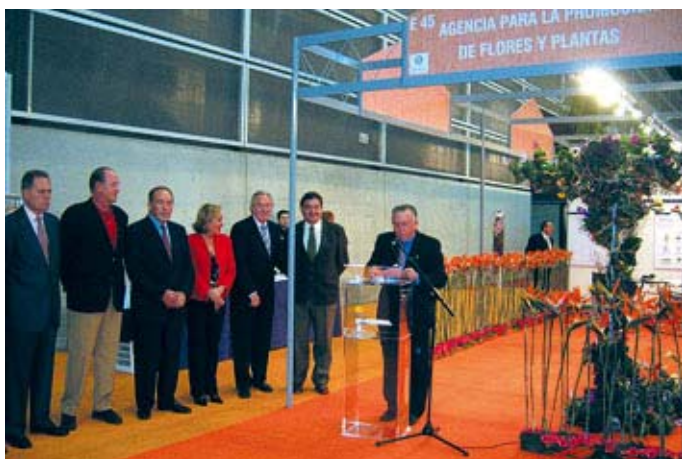
En el marco de Iberflora se presentó la Agencia para la Promoción de Flores y Plantas promovida por las asociaciones más representativas de la producción y el comercio.

de los cinco continentes, como Australia, Costa Rica, Egipto, Francia, Guatemala, Holanda, Irán, Italia, Marruecos, Nicaragua o Portugal