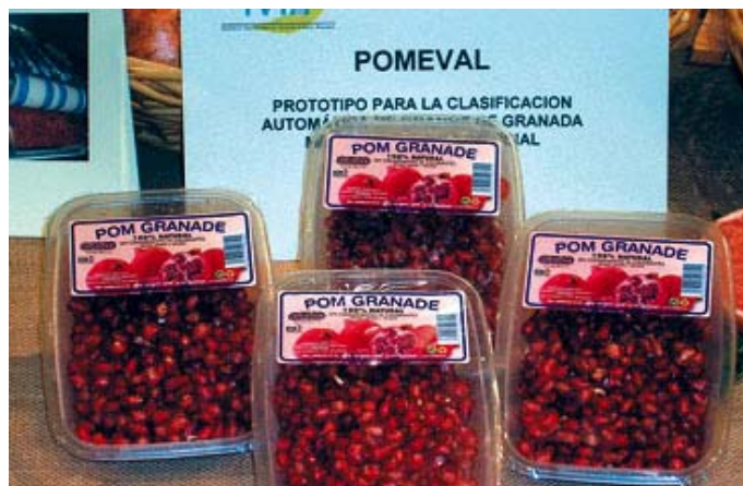
Prototipo de envase de granada procesada en IV gama.

Más de 80 empresas participaron en este encuentro que tiene como objetivo aprovechar las diferencias climáticas de ambos hemisferios para abastecer al mercado europeo durante todo el año de productos hortofrutícolas. Algunos productos que se cultivan en América Latina tienen épocas de producción distintas a las europeas, por lo que el AI-Invest es una importante oportunidad de abastecer a toda Europa con productos latinoamericanos cuando no se pueden producir en Europa.