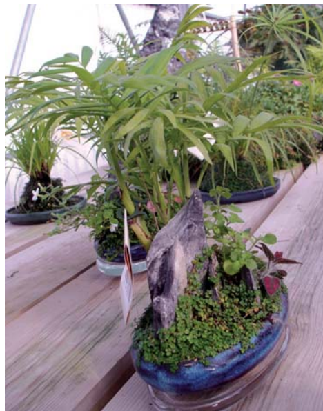
Las plantas de acento son parte de los paisajes en miniatura denominados Feng Lui, combinando plantas y rocas.