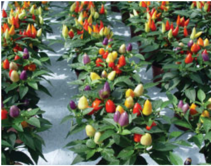
En Global Flowers una línea de mejora genética y obtención de variedades es la de pimiento ornamental.