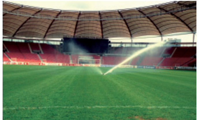
La solución más adecuada para este tipo de instalaciones es la instalación de un sistema de riego perimetral, con aspersores de largo alcance.