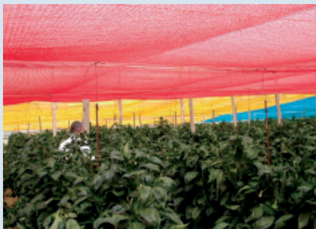
Chromatinet® son mallas de sombreado coloreadas con características espectrales únicas, producidas con polietileno multicapa.

El pimiento es uno de los cultivos más importantes de Almería. Se acostumbra a plantar entre los meses de junio a agosto en invernaderos bajo plástico. Estos meses son muy calurosos y con altos niveles de radiación solar, por lo cual se debe utilizar sombreado. Lo usual es el encalado del polietileno durante las épocas calientes y luego lavarlo. Otra forma es la utilización de pantallas térmicas móviles, controlando los niveles de radiación solar y temperatura en el invernadero.