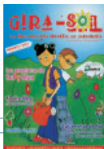
Gira-sol desea ofrecer a los niños un mayor conocimiento de la jardinería.