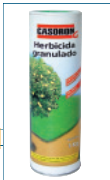
Herbicida de gran eficacia contra las malas hierbas.