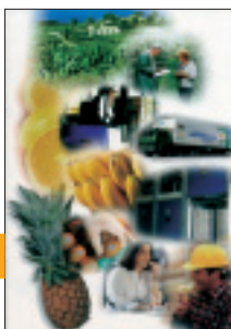
Eurobanan Canarias, es líder en la comercialización de plátanos verdes y maduros.