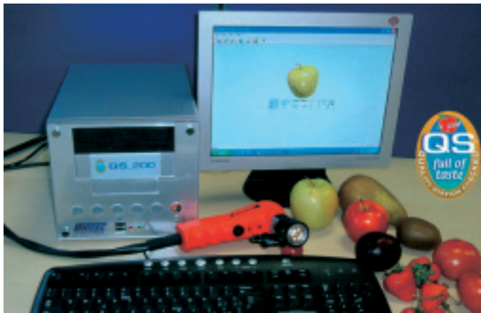
Los parámetros evaluados con el analizador QS_200 son contenido en azúcares, firmeza, estado de maduración y acidez.