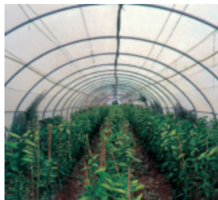
Repsol YPF Química dispone de una amplia gama de plásticos para la construcción de cubiertas en invernaderos.