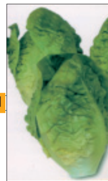
La variedad Attico, produce plantas vigorosas de excelente formación.