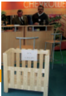
La madera puede ser una excelente materia prima para envases y contenedores.