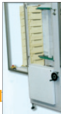
TF12 Evolucioné, es capaz de conformar cajas de diferentes tipos.