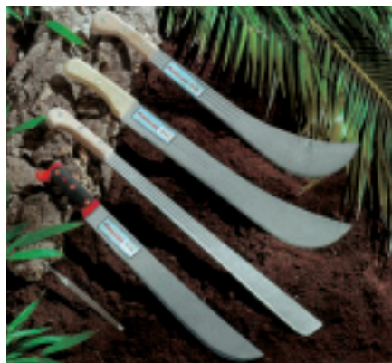
Uno de los productos estrella de la marca Muller es el nuevo formón con mango bimatierial.