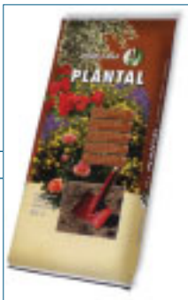
Se comercializa en sacos de 50 y 80 litros.

La herramienta se sirve tanto sin mango como con mango de madera de 1200 mn. totalmente lacados. Su unión fija a la herramienta se realiza mediante encaje seguro en el cubo.