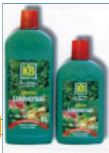
Se presenta en botellas de 500 ml y de 1 litro.