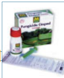
Dentro del envase contiene unos guantes de latex para su segura y correcta aplicación.

La herramienta se sirve tanto sin mango como con mango de madera de 1200 mn. totalmente lacados. Su unión fija a la herramienta se realiza mediante encaje seguro en el cubo.