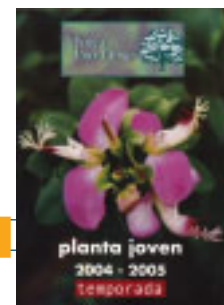
Dos tipos de plantales: Plantel de otoño, que se sirve a partir de septiembre y Plantel de primavera, que se sirve a partir de abril.