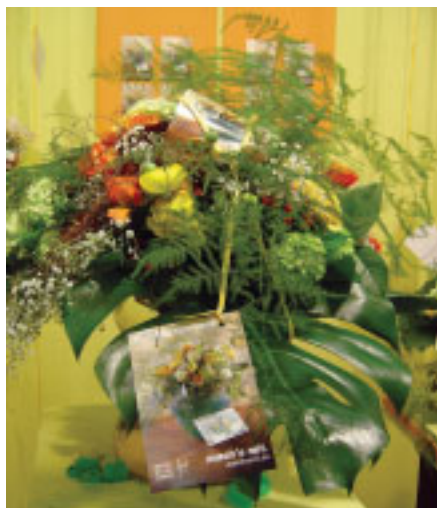
La versatilidad de las flores es casi infinita...