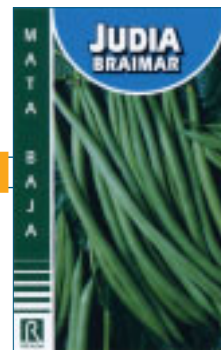
Producción elevada y escalonada. Planta vigorosa y rústica. Se comercializa en cajas de 100 y 250 gr. en sacos de 1 y 5 kg.