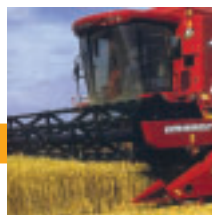
La compensación de inclinación asegura la máxima estabilidad.