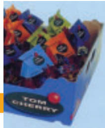
Nueva forma de comer tomates divertida y sana para toda la familia.