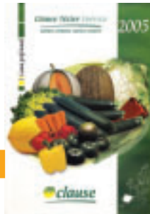
En él podemos encontrar las especies de hortalizas y sus variedades más recientes.