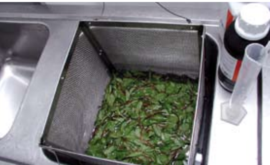
Tat soi UV-C y lavado de vegetales.