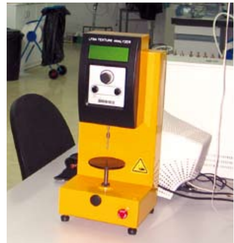
Planta Piloto GPR.

El alto CO 2 provoca una disminución del pH, tanto extra como intracelular, interfiriendo con el metabolismo de las células