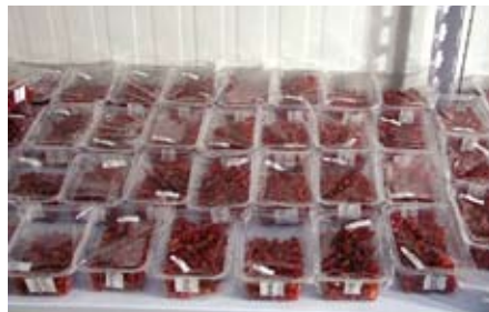
Conservación de granada procesada en fresco.

El ozono (O 3 ) puede ser muy importante en el lavado de productos MPF, al reducir la flora microbiana en la superficie de los alimentos. La solubilidad del O 3 depende de la temperatura, pureza y pH del medio. Los lavados de escarola MPF mediante duchas con agua ozonizada (0,4 ppm) incrementaron el efecto microbicida del O 3 frente al lavado por inmersión del producto (Aguayo et al., 2009a). En tomate "Thomas" cortado en cascotes y almacenados 10 días a 5°C se logró una notable reducción frente al testigo con los lavados ozonizados (3,8 ppm y 3 min) de 1,9; 1,6 y 0,7 unidades log en los recuentos de mesófilos, psicrotrofos y levaduras, respectivamente (Aguayo et al., 2005). También se ha comprobado que la conser-