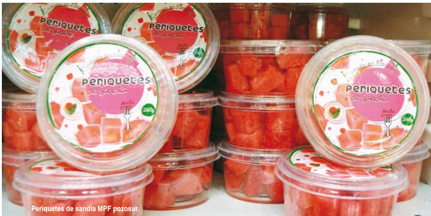
Periquetes de sandía MPF pozosur.

Innovaciones tecnológicas para preservar la calidad