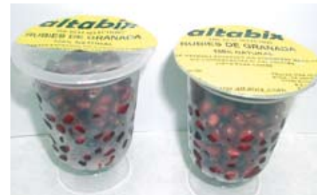
Tarrinas de granada.

Los productos MPF pueden sufrir desórdenes fisiológicos como el amarillamiento (brócoli), blanqueamiento (zanahorias), pardeamiento (lechuga, hinojo), ablandamiento, etc. que podrían reducirse con la aplicación de disoluciones de productos químicos que pueden incorporarse en el lavado o tras el enjuague. Para evitar el pardeamiento existen acidulantes (ácido cítrico), agentes reductores (ácido ascórbico), e incluso quelantes (pírofosfato de sodio). Gómez y Artés (2004) observaron en apio cortado en secciones que una solución de ácido ascórbico (0,5 M) y ácido acético (0,1M) tenía igual eficacia para reducir la flora microbiana que el lavado con 100 mg L -1 NaClO. En rodajas de manzana, la aplicación de ascorbato cálcico al 12% redujo el pardeamiento tras 28 días a 4°C (Aguayo et al., 2009b). Estos baños pueden incluir la aplicación de películas comestibles que reducen las pérdidas de agua (deshidratación y ablandamiento) y protegen al producto del O 2 , retrasando el pardeamiento. Se han utilizado películas a base de calcio como puente de unión a las sustancias pécticas en la pared celular y lámina media (mejora la firmeza y disminuye el ablandamiento) y