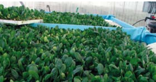
Espinaca cultivadas en bandejas flotantes.

jo, colirrábano y en numerosos brotes de hortalizas foliáceas (tatsoi, rúcola, red-chard, mizuna, colleja, verdolaga, etc). Por lo general se evalúan descensos de 1 a 2 unidades log en el crecimiento de microorganismos mesófilos, psicrotrofos y de enterobacterias respecto al tratamiento con 100-150 ppm NaClO a pH 6,5. Otros desinfectantes que actualmente se propugnan son las bactericinas, compuestos de tipo proteico con efecto bactericida, producidos por diferentes estirpes bacterianas. Las más utilizadas son nisinas, aunque también se emplean pediocinas, plantaricinas y lactocinas. Con 250 mg/L de nisina combinada con 100 mg de EDTA, se ha logrado controlar el crecimiento microbiano en melón "Galia" MPF (Silveira et al., 2008).