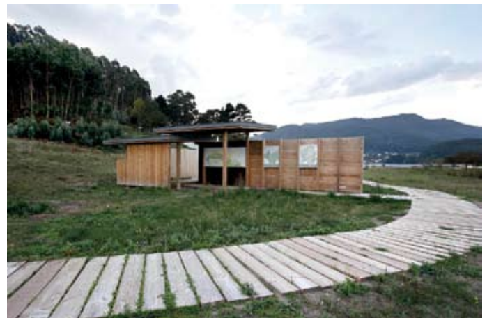
Área de información y descanso, colocación de bardisas en primer frente dunar e implantación de autóctonas dunares.