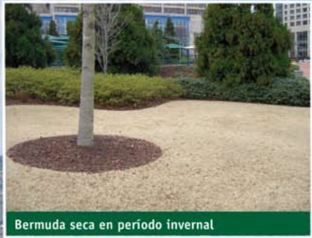
Bermuda seca en período invernal