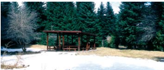
SIAH ARMAJANI Mesa picnic para Huesca, 2000 Madera de iroco Valle de Pineta. Huesca