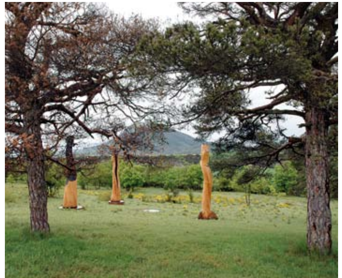
DAVID NASH Three Sun Vessels for Huesca, 2005 Tres vessels de roble (430 x 90 cm) y rosa de los vientos de bronce (120 cm diámetro) Ermita de Santa Lucía. Berdún. Huesca