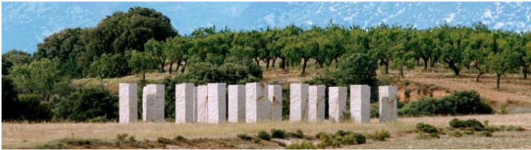
ULRICH RÜCKRIEM Siglo XX, 1995 20 estelas de granito rosa Porriño (400 x 100 x 100 cm) Abiego. Huesca